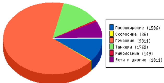
Рис. 3 – Загальна кількість судозаходів в Україну по типах судів [14]

Аналізуючи дану інформацію, слід зауважити, що у України як морської держави є декілька варіантів майбутнього розвитку морського круїзного туризму: