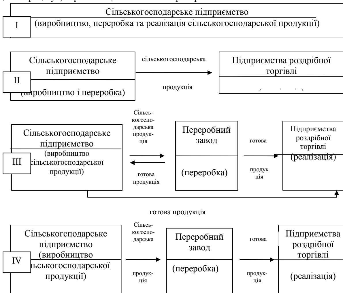
Рис. 1.2 Моделі виробництва, переробки і реалізації сільськогосподарської продукції

відповідають різні типи економічних взаємовідносин підприємств, що беруть участь у даному процесі. Розглянемо їх з точки зору ефективності для господарюючих суб'єктів цього процесу і, перш за все, сільського товаровиробника.