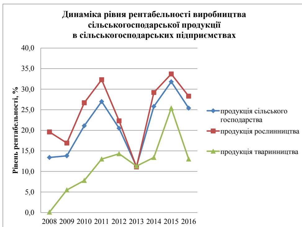
Рис. 3. Динаміка рівня рентабельності виробництва сільськогосподарської продукції в сільськогосподарських підприємствах

За досліджуваний період рівень рентабельності продукції рослинництва зріс на 8,7 п. п.