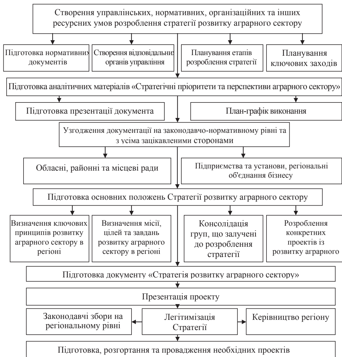
Рис. 2. Схема процесу розроблення Стратегії розвитку аграрного сектору Столичного економічного району