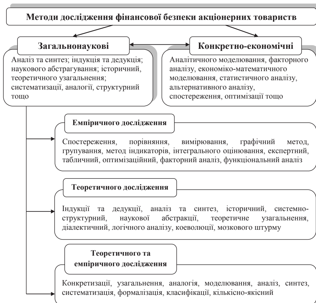
Рис. 1. Сукупність методів дослідження фінансової безпеки акціонерних товариств

Виклад основного матеріалу дослідження. Перш ніж перейти до ідентифікації методів наукового пізнання фінансової безпеки корпоративних структур, сформулюємо загальний підхід до сутності поняття «метод». Отже, сучасна наукова думка під методом розуміє визначену послідовність дій, прийомів, операцій і засобів досягнення поставленої мети, яка може бути як практичною, так і теоретичною та пізнавальною [4, с. 184]. На нашу думку, цілісність наукового дослідження фінансової безпеки акціонерних товариств