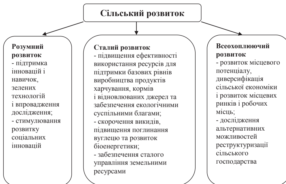
Рис. 3. Сільський розвиток у контексті Стратегії «Європа 2020»