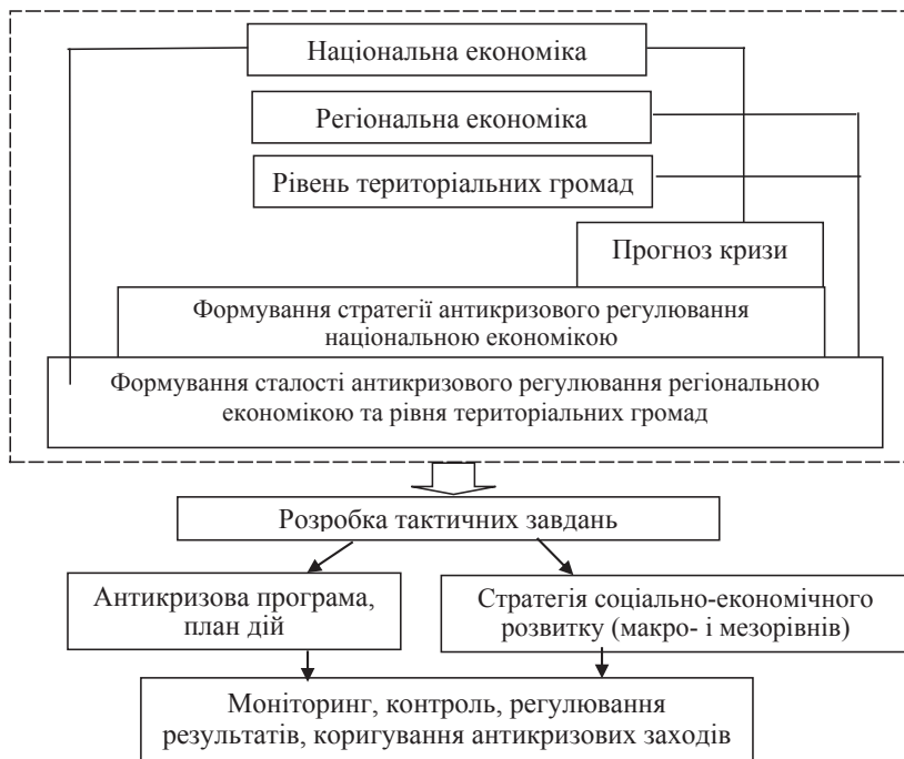
Рис. 1. Концептуальна схема розробки механізму антикризового регулювання національної економіки в умовах децентралізації

Застосування системного підходу в механізмі антикризового регулю-