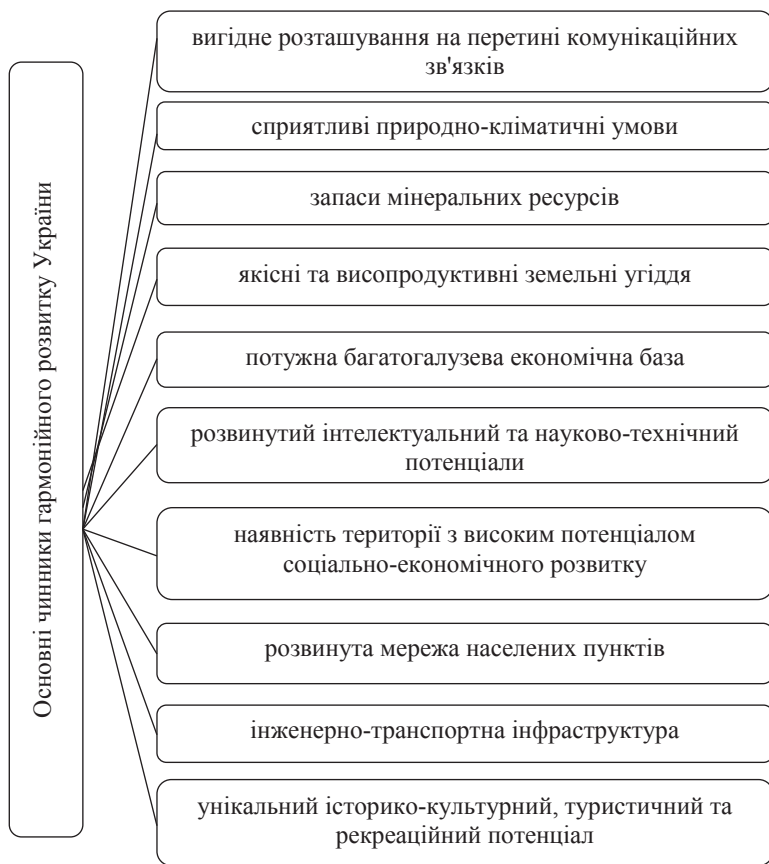
Рис. 1. Еколого-економічні чинники, що визначають гармонійний розвиток України [10]

Під час дослідження ринкової економіки на предмет наявності в ній ознак гармонії вченим вдалося встановити таку закономірність. Саме присутність узгодженості, стрункності (або порядку) в пропорціях складових частин бізнес-процесів значно посилює адаптаційні якості підприємства і забезпечує його успішний стійкий розвиток, а відсутність узгодженості і стрункності приводить до неефективного використання