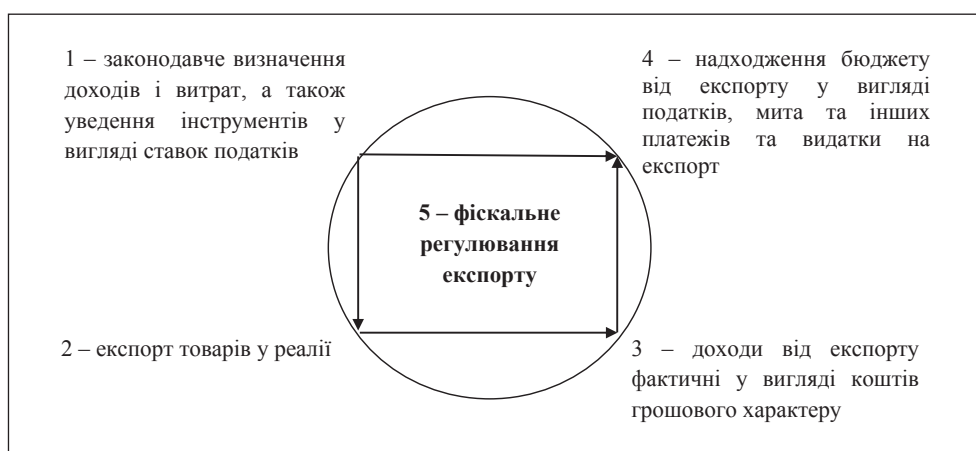
Рис. 1. Елементи фіскального регулювання експорту

Третім елементом розробленої мислесеми (рис. 1) виступає дохід від експорту. На нашу думку, цей показник в Україні визначається вартістю експорту товарів відповідно до даних Державної служби статистики [6], де варто окремо виділити дохід від експорту товарів, які обкладаються вивізним (експортним) митом (табл. 1), що є частиною фіскального регулювання, і