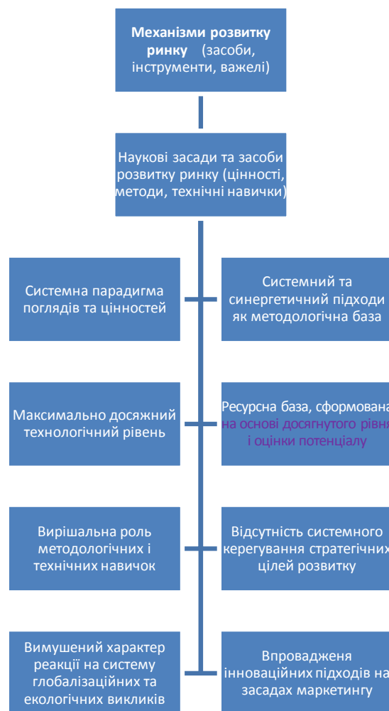
Рис. 1. Сучасна модель парадигми розвитку ринкових механізмів

З урахуванням виділених характерних рис сучасної парадигми розвитку ринкових механізмів, побудуємо її модель, як показано на рис. 1.