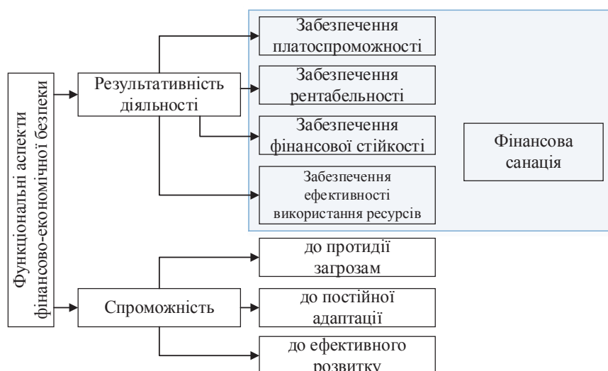
Рис. 2 Функціональні складники фінансово-економічної безпеки підприємства

Дієвим механізмом виведення підприємства зі стадії збитковості, покращення його фінансового становища, формування конкурентоспроможності на вітчизняному ринку будівельних матеріалів є фінансова санація. Розроблення плану заходів із фінансового оздоровлення ґрунтується на комплексному аналізі техніко-економічних та фінансових показників. У табл. 2 наведено коефіцієнтний аналіз фінансового стану ТОВ «Мінова Україна» за напрямками: показники структури капіталу, рентабельності, фінансової стійкості, ліквідності та платоспроможності. Ці ж показники за різними методиками станов-