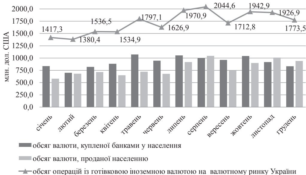
Рис. 3. Обсяг операцій із готівковою іноземною валютою на готівковому валютному ринку України за 2018 р.

Відповідно, пропозиція на іноземну валюту на безготівковому валютному ринку України формується за рахунок обміну іноземної валюти іноземними інвесторами, що здійснюють інвестиції в Україні, продажу іноземної валюти НБУ під час проведення валютної інтервенції, потреби в обігових коштах національних