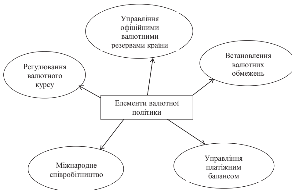
Рис. 1. Елементи валютної політики

Динаміка показників міжбанківського валютного ринку України (далі – валютний ринок) у 2014 р. склалася під впливом складної політичної ситуації в країні та розгортання воєнного конфлікту в східних її областях, на які традиційно припадало понад 20% вітчизняного експорту. У результаті суттєво