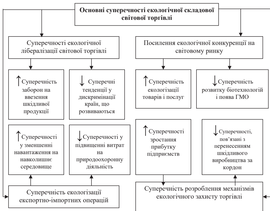
Рис. 2. Основні суперечності екологічної складової світової торгівлі

Примітка: ↑ – позитивний вплив, ↓ – негативний вплив