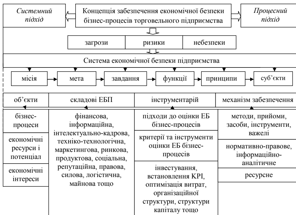
Рис. 2. Концепція забезпечення економічної безпеки бізнес-процесів торговельного підприємства

Погоджуємося з думкою дослідника [12, с. 75] про те, що використання одного з наявних наукових підхо-