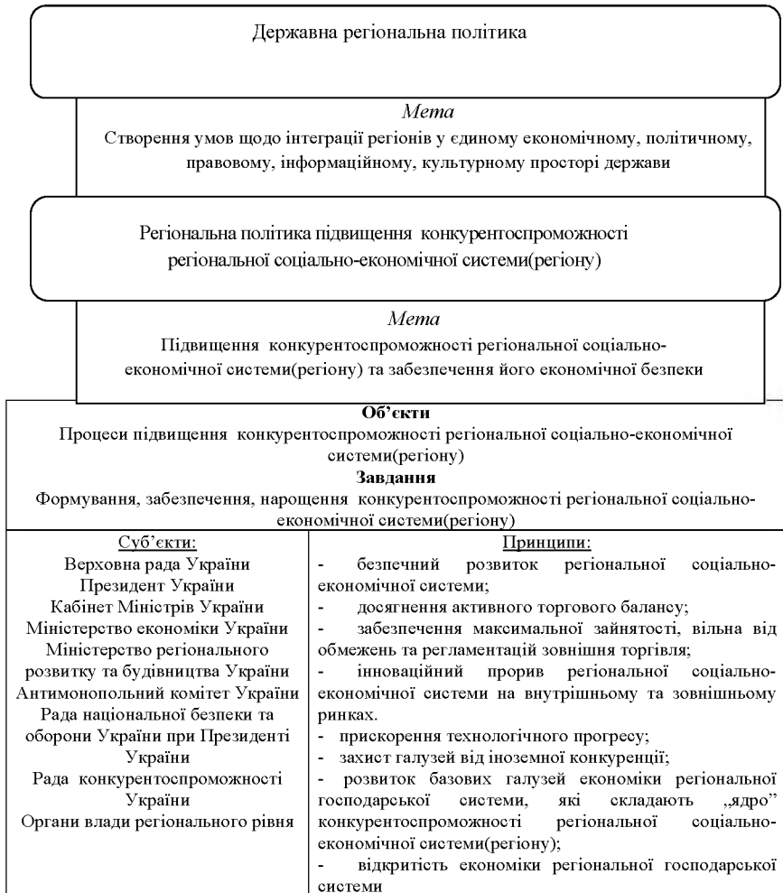
Рис.2. Зміст регіональної політики щодо підвищення рівня конкурентоспроможності регіональної соціально-економічної системи (регіону)

нальної соціально-економічної системи (регіону) та забезпечення його економічної безпеки.