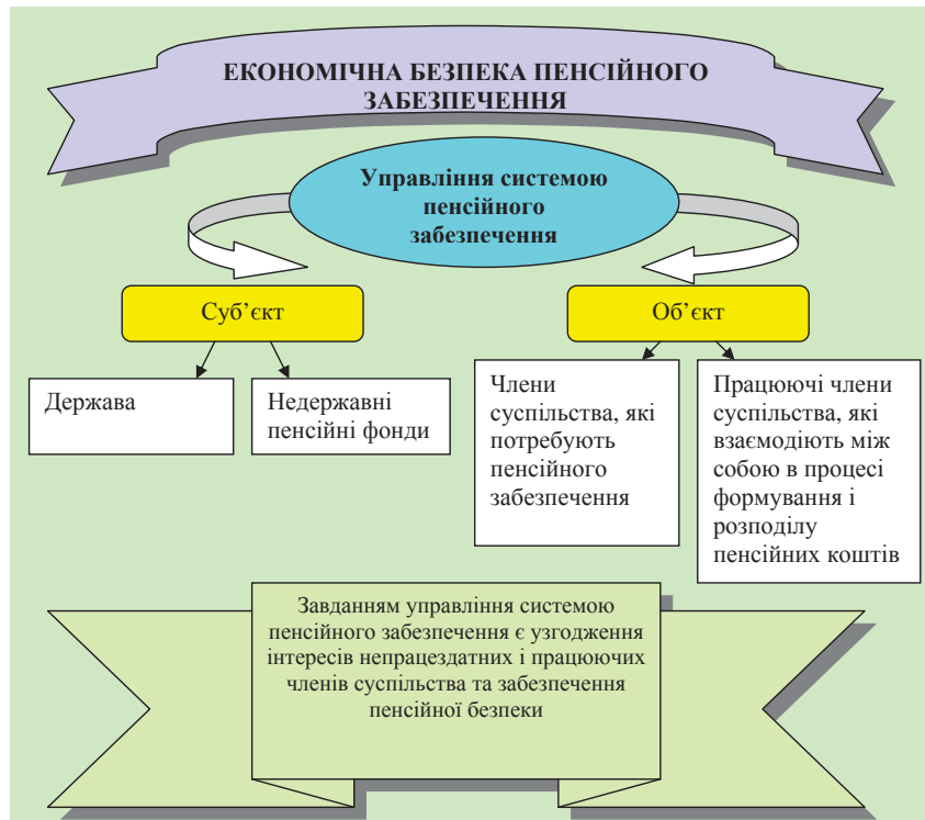
Рис. 2. Вплив суб'єктно-об'єктних відносин управління системою пенсійного забезпечення на економічну безпеку пенсійного забезпечення

Схематично суб'єктно-об'єктний склад таких відносин та їх вплив на економічну безпеку пенсійного забезпечення відобразимо на рис. 2.