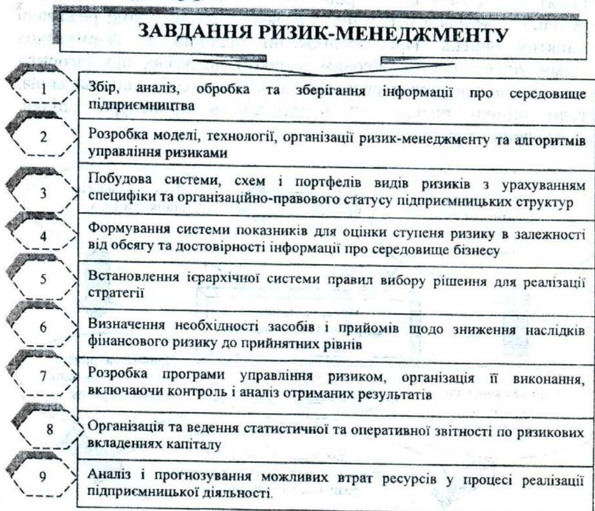
Рис. 1. Основні завдання ризик-менеджменту

Основні завдання для досягнення цілей ризик-менеджменту забезпечуються наявністю блоку прийняття рішень, безпосередньо спрямованих на зниження ступеня ризику. Блок прийняття рішень, що дає можливість оцінити ефективність розроблених стратегій і тактики ризик-менеджменту, пов'язаний багатоваріантністю рішень, поєднанням стандарту і неординарності фінансових комбінацій, гнучкості та неповторності тих чи інших способів дій в конкретній ситуації [5].