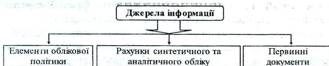
Рис. 2. Джерела інформації для проведення контролю

На рис. 2. представлені джерела інформації, які можуть використовуватися при здійсненні контролю.