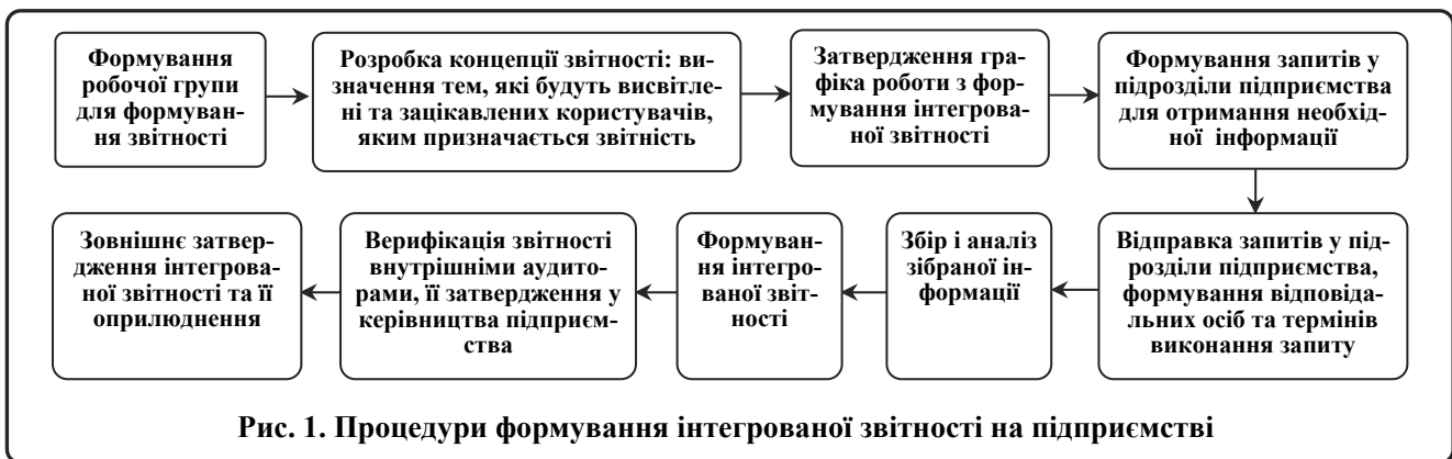
Рис. 1. Процедури формування інтегрованої звітності на підприємстві

На кожному етапі процедури формування інтегрованого звіту (рис. 1) мають бути чітко визначені наступні елементи: 1) необхідні дані; 2) відповідальні особи; 3) строки виконання.