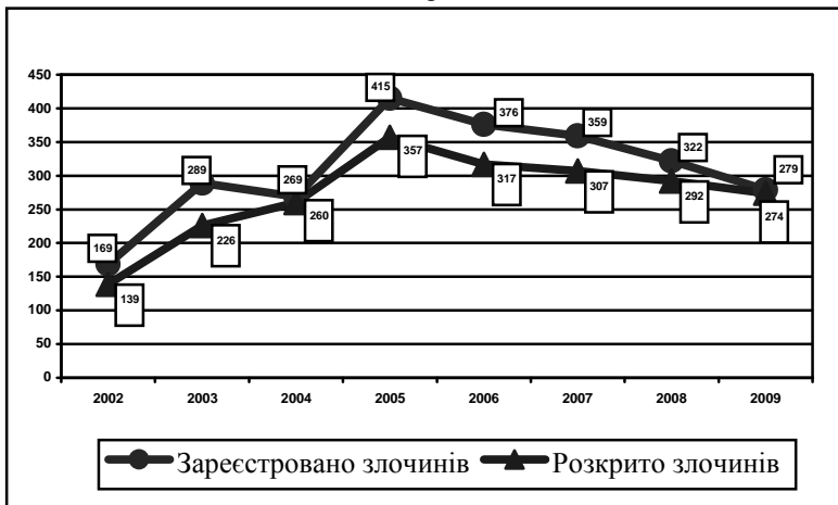
Динаміка вчинення і розкриття злочинів, пов’язаних з торгівлею людьми

Рисунок 1. Порівняльна динаміка вчинення і розкриття злочинів, пов’язаних з торгівлею людьми, за період з 2002 по 2009 рр.