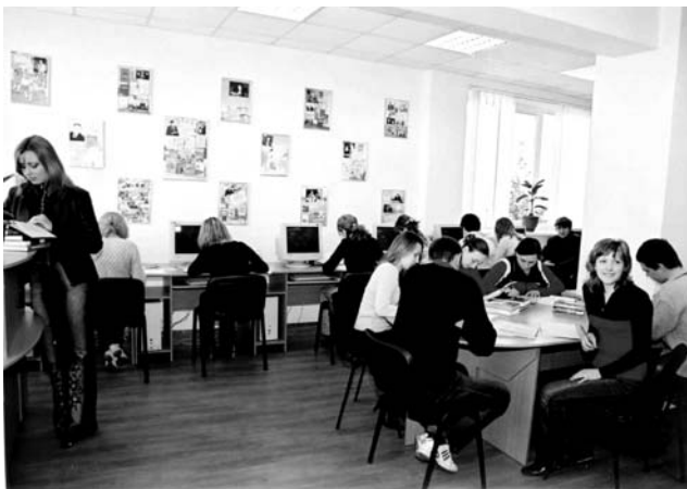
Інтегрований читальний зал

Працівники бібліотеки – це молоді люди, захоплені своєю роботою, вони володіють навичками критичного мислення, добре розуміють сутність та особливості бібліотечної роботи з користувачем, наділені творчими здібностями – пишуть вірші, складають сценарії свят, малюють тощо. Анкетування, які неодноразово проводилися у бібліотеці, засвідчують, що саме таким і хочуть бачити бібліотекаря наші студенти – сучасною людиною у всіх її проявах: інтелектуально розвиненою, всебічно обізнаною, модно одягнутою, красивою, привітною і завжди усміхненою.