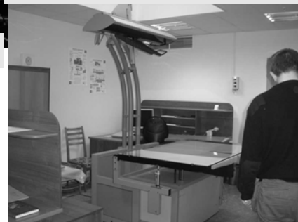
Сканер для сканування газет

Бібліотека розпочала формування електронного архіву національної періодики, причому доступ до електронної версії газет можливий ще до появи