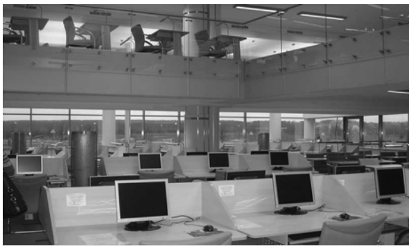
Читальний зал для науковців

року структуру бібліотеки змінювали шість разів.