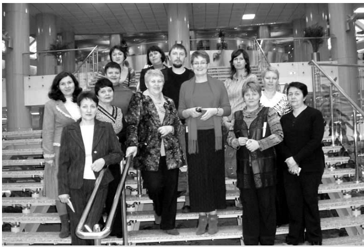
Делегація НПБ України. В центрі – заступник директора НБ Білорусі Т. Кузьмінч

Зацікавив досвід бібліотуризму, що передбачає серію поїздок білоруських бібліотекарів до бібліотек різних країн світу.