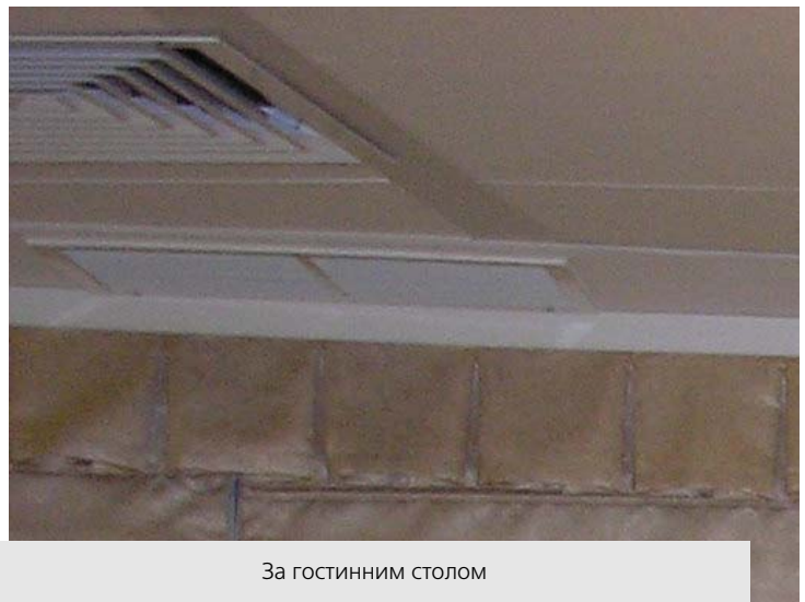
За гостинним столом

Незважаючи на дуже ранній час (київський потяг прийшов до Мінська о шостій годині ранку), делегацію зустріли на вокзалі і на мікроавтобусі, подарованому Урядом Китайської Народної Республіки, відвезли до нової будівлі НБ Білорусі. Напередодні, 21 грудня, відбулася церемонія підписання акту здачі-приймання ще й іншого об-