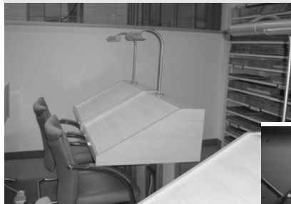
Робочі столи газетного залу

що НБ Білорусі не є зараз бібліотекою у звичному, традиційному розумінні, адже тут на перше місце вийшла соціокультурна та іміджева діяльність, причому на високому державному рівні. Будь-які визначні державні події в