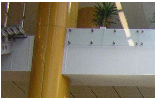
Центральні сходи НБ Білорусі

Метою візиту був обмін досвідом і вивчення інноваційних методів діяльності бібліотек у сучасних умовах.