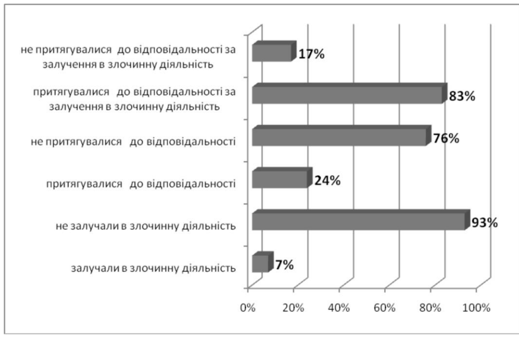
Мал. 1. Протиправна поведінка батьків як детермінанта злочинності неповнолітніх

Також ми намагалися визначити причини агресивної поведінки неповнолітніх, оскільки існує зв'язок між різними характеристиками сім'ї та можливістю розвитку агресивної поведінки. Адже така поведінка веде до вчинення таких злочинів, як убивство, заподіяння тілесних ушкоджень різного ступеня тяжкості,