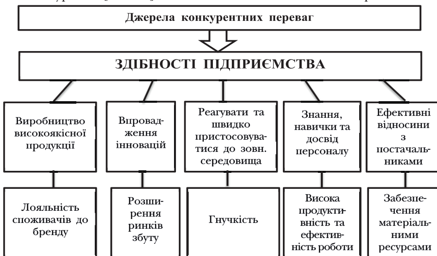
Рис. 2. Джерела конкурентних переваг підприємства (розроблено автором)

Наявні компетенції нерідко встановлюють новий стандарт якості в галузі і,