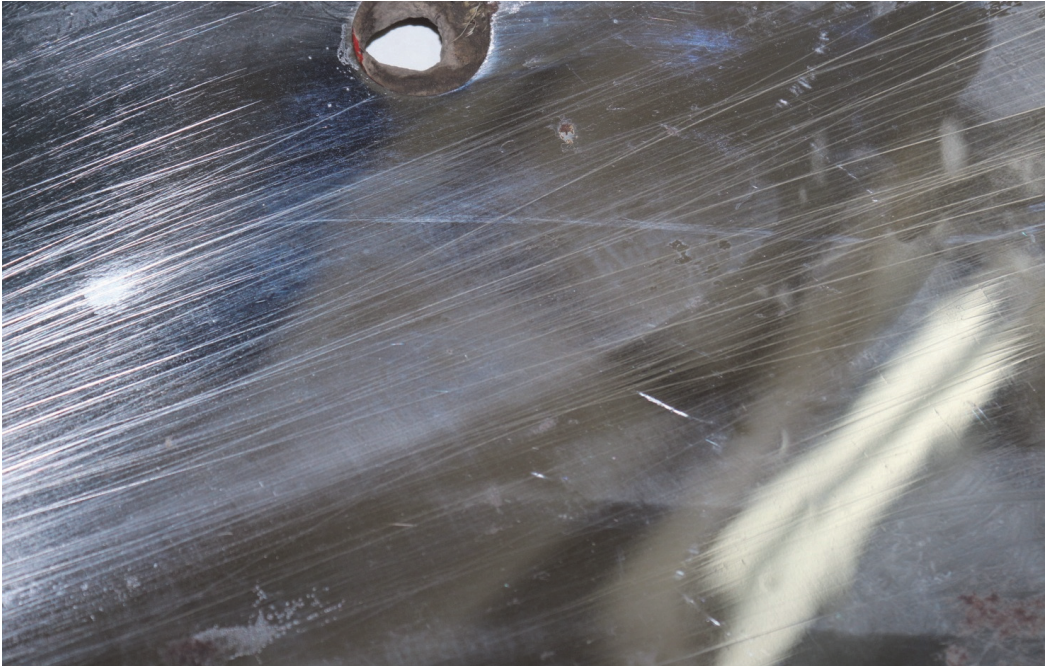
Рис. 4. Поверхня полиці плуга Kverneland (зона 1).

ва для всіх деталей, які взаємодіють із ґрунтом. Підтвердження цього ми отримали і для робочих органів сівалок John Deere 3S-4000HD, СЗ-5,4 і Amazone Centaya, де підвищення поверхневої мікротвердості складало 7,2...11,4 %.