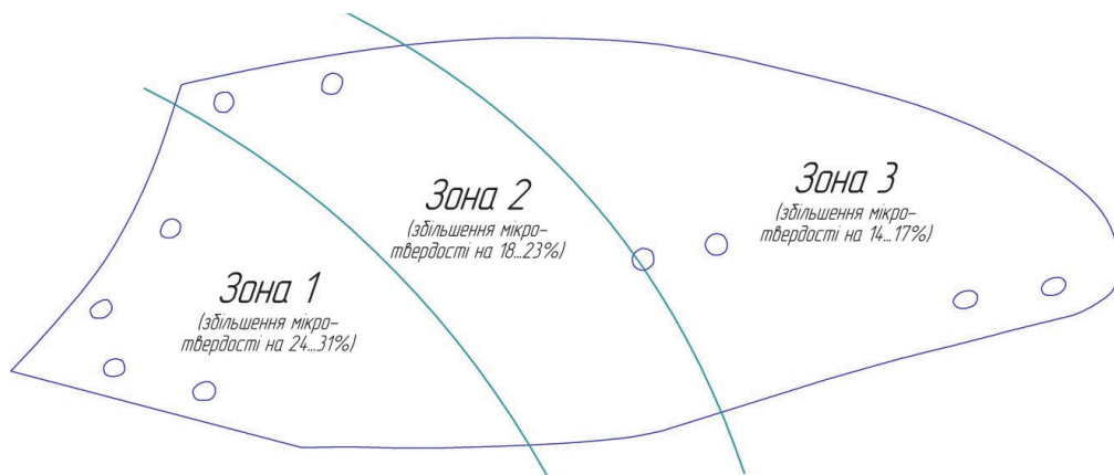
Рис. 3. Зміна твердості на поверхні полиці плуга Kverneland у результаті взаємодії з ґрунтовим середовищем.

Закономірність підвищення мікротвердості на поверхні робочих органів, що працюють у ґрунті справедли-