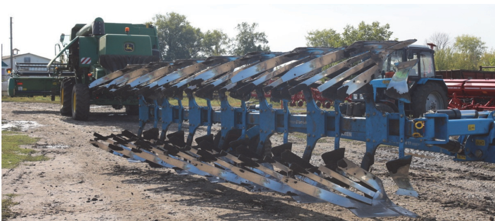
Рис. 1 Загальний вигляд плуга Diamant 11 фірми Lemken

Дослідження зміни твердості поверхні лемішно-лапових робочих органів проводили на агрегатах: