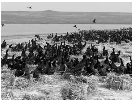
Рис. 2. Фрагмент колонии большого баклана на оз.Ачи (май, 2007 г.). Большинство составляют молодые птицы.

Колония находится на вытянутом в меридианальном направлении островке длиной около 250 и шириной около 70 м, расположенном в 110 м от юго-восточного берега озера. В засушливые годы, при низком уровне воды, островок соединяется с берегом. Его центральная возвышенная часть покрыта травянистой растительностью (доминируют Atriplex sp. и Descurainia sophia ). Бакланы гнездятся в северной, свободной от растительности, части островка. Расстояние между гнездами составляет 0.5 м и менее (рис. 2). Рядом с колонией бакланов находится колония хохотуньи ( Larus cachinnans ) численностью до 250 пар.