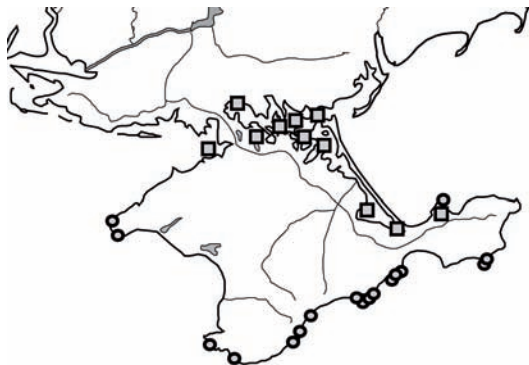
Рис. 2. Поселения Larus michahellis на приморских скалах Крымского полуострова (кружки) и поселения Larus cachinnans на равнинных островах у его северных берегов (квадраты).