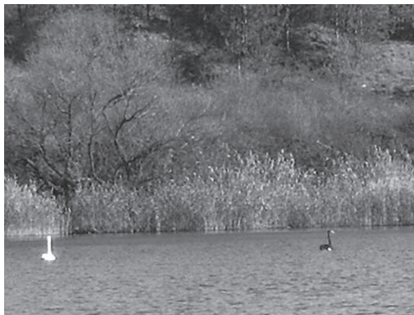
Рис. 2. Черный лебедь и лебедь-шипун в заповеднике

За время учетов водно-болотных птиц, самой курьезной и странной была встреча черного лебедя ( Cygnus atratus ) 26.10.2014 г. в районе Дойбанского залива (рис. 2). Этот лебедь держался в группе 4 лебедей-шипун, кормился вместе с ними, когда мы решили проверить сможет ли он летать, то черный лебедь вполне легко поднялся на крыло вместе с шипунами, и они все вместе перелетели на другой участок водоема. По данным инспекторов заповедника, этот черный лебедь жил здесь около недели.