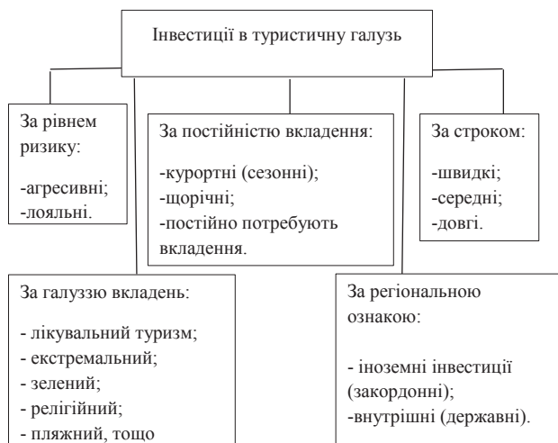
Рис. 1. Види інвестицій в туристичну галузь (власна розробка авторів)

Дослідження Всесвітньої організації туризму та подорожей (WTTC) підтверджують статистику прибутків туристичної індустрії. Так, за даними WTTC, доходи від цієї галуззі в Світі на 2015 р. склали 1550 млрд дол. США, тобто майже у три рази перевищили рівень 2010 р., а прогноз до 2020 р. передбачає до 2000 млрд дол. США [8].