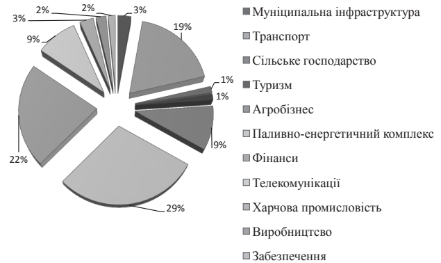
Рис. 4. Державне фінансування галузей в Україні

булося через кризу, яка виникла ще в 2015 р. та триває і на теперішній час. У достатній мірі інвестуються лише ті галуззі, які держава вважатиме за потрібне.