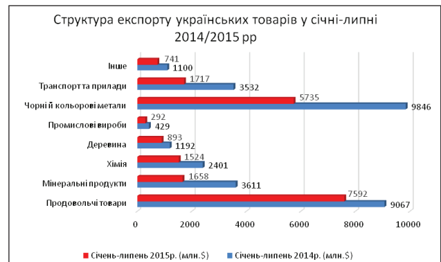
Рис. 1. Структура експорту українських товарів у січні-липні 2014–2015 рр.

Загалом, структура експорту українських товарів у січні-липні 2014–2015 рр. наглядно представлена на рисунку 1.