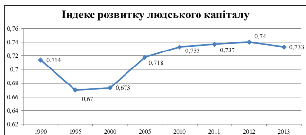
Рис. 1. Динаміка індексу розвитку людського капіталу в Україні за 1990-2013 рр.

1) зниження рейтингу індексу розвитку людського капіталу. В міжнародному рейтингу індексу розвитку людського капіталу, що розраховується щорічно для порівняння країн і визначення рівня життя, грамотності, освіченості та довголіття, у 2013 році Україна посіла 83 місце серед 187 країн, і була віднесена до країн із високим рівнем розвитку людського потенціалу (50 місце). Значення індексу розвитку людського потенціалу у 2013 році в Україні сягало 0,733. Варто зазначити, що порівняно із 2012 роком місце України у рейтингу не змінилося, проте порівняно з 2011 роком вона втратила сім позицій, стільки ж втратила у 2011 році порівняно із 2010 роком (тоді була 69 у рейтингу) [10].