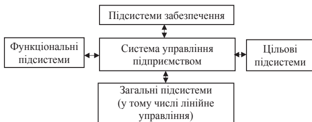
Рис. 1. Функціонально-цільова структура системи управління підприємством

У результаті поєднання названих підсистем управління утворюється функціонально-цільова структура системи управління підприємством, яка схематично приведена на рис. 1.