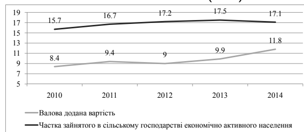
Рис. 1. Показники ролі сільського господарства в економіці України в 2010–2014 рр., % до загального підсумку [6, с. 30, 35]

Як показник ролі сільського господарства в економіці застосовують частку зайнятого в сільському господарстві економічно активного населення (рис. 1), а також питому вагу сільського господарства в структурі ВВП. Ці показники достатньо високі в більшості країн, що розвиваються, де в сільському господарстві зайнято більше половини економічно активного населення (ЕАН).