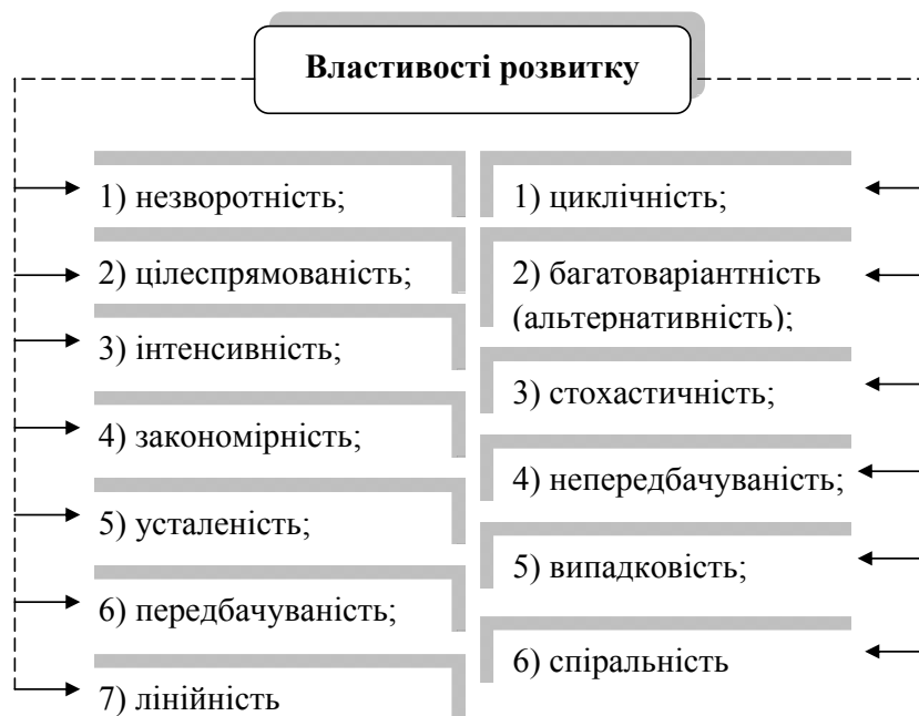
Рис. 1. Властивості розвитку

Окреме місце в економічному ракурсі дослідження категорії «розвиток» займає розвиток підприємства. Підвищений інтерес науковців до феномену розвитку підприємства породжує значку кількість підходів до трактування сутності цього поняття. Дослідження теоретичних засад проблематики розвитку підприємства на основі опрацювання значної кількості наукових публікацій дало змогу виявити значні розбіжності у визначенні природи цього поняття, його сутності та складових елементів.