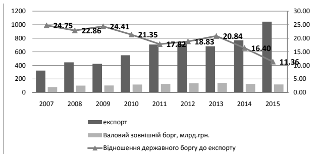
Рис. 3. Відношення державного боргу до експорту в 2007–2015 рр.

Згідно з даними рис. 3, можна говорити про задовільний показник відношення зовнішнього боргу до експорту, що не перевищує рекомендованих 70%. Але чи є він інформативним для нас, адже більшість коштів із зовнішніх джерел направляються на рефінансування боргових зобов'язань, тому ці кошти не можуть здійснити прямий вплив на виробництво експортної продукції.