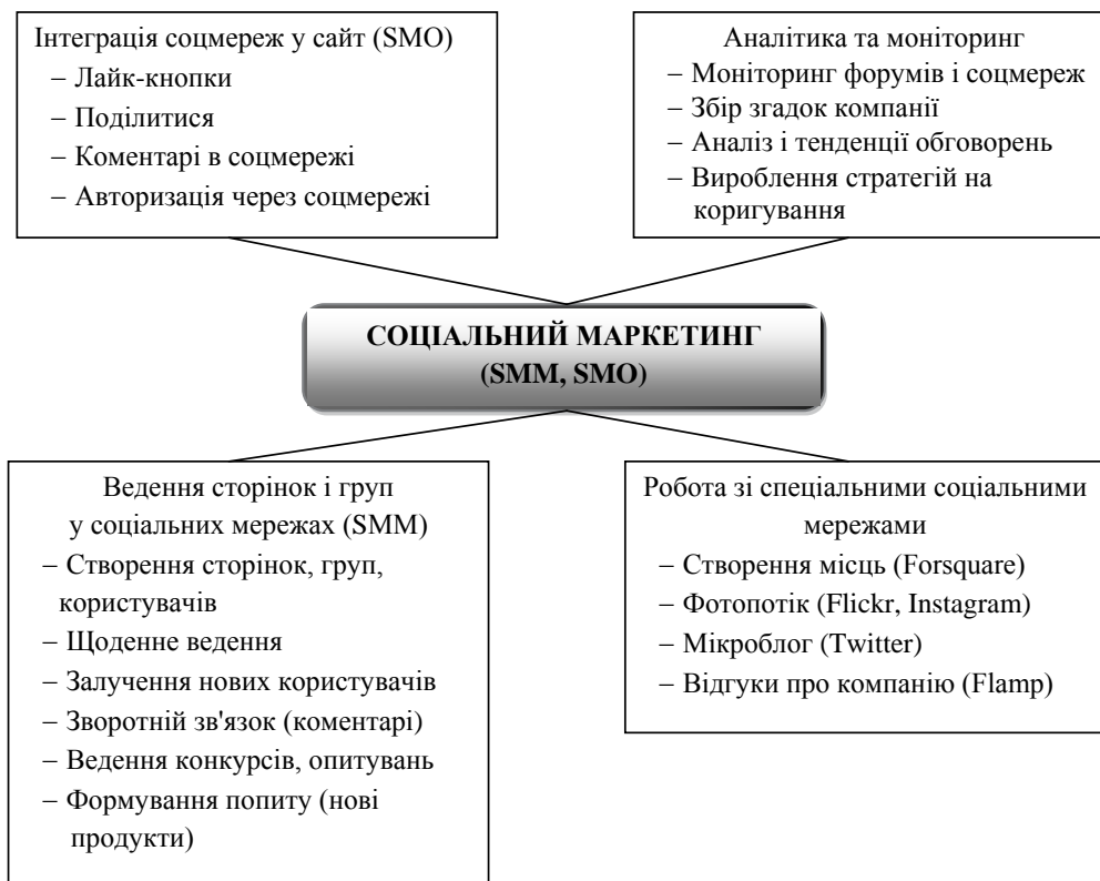
Рис. 3. Основні елементи соціального маркетингу МК

Зазначимо, що термін «трендсеттер» увів французький соціолог Габріель Тард у 1903 р. Саме він наголосив на важливості міжособистісної комунікації і ввів також поняття «лідерство громадської думки», яке кілька десятиліть потому набуло величезного значення для наукових досліджень медіавпливу. Пізніше термін у книзі Diffusion of innovations задав теоретик Еверет Роджерс. Трендсеттер – це людина, яка встановлює матеріальне або нематеріальне нововведення. Багато чого маркетологи знають (або повинні знати) про теорію дифузійної комунікації. Суть цієї теорії в тому, що ідеї ніколи не охоплюють суспільство цілком в один момент. Вони поступово просочуються через різні верстви населення, тому немає сенсу впливати на все суспільство цілком, а необхідно переконати передусім найбільш активну його частину [6].