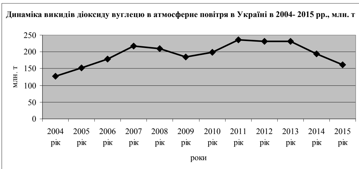
Рис. 1. Витрати на охорону та використання природних ресурсів України за напрямками в 2015 р., тис. грн. [1]

По-третє, підписання в березні 2015 р. Угоди між Україною і Європейським Союзом про участь України у Рамковій програмі ЄС із наукових досліджень та інновацій «Горизонт 2020». Участь України у цій програмі передбачає доступ до всього