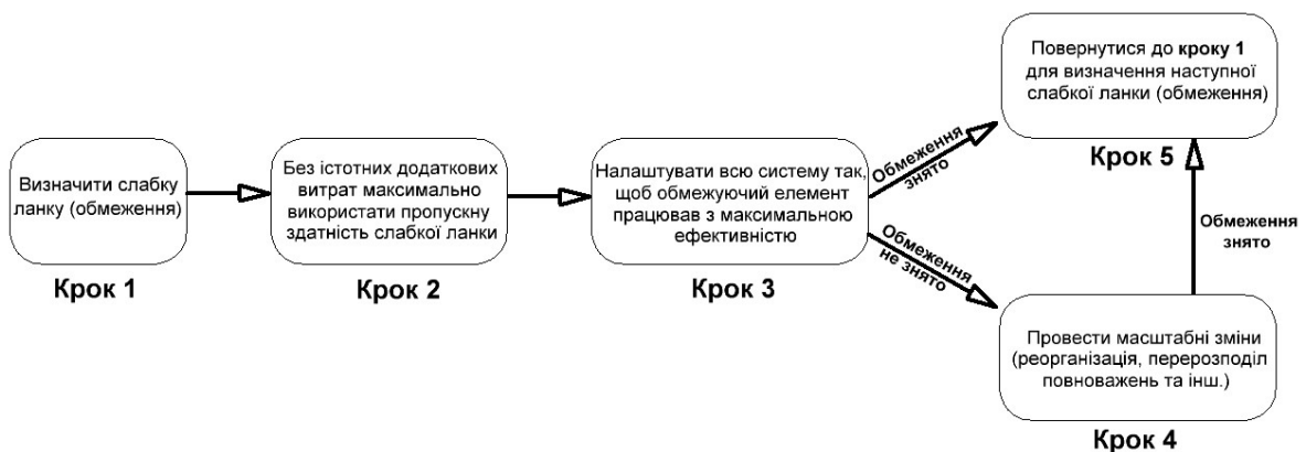
Рис. 3. Управління системою через її обмеження

ТОС стверджує, що у кожній системі існує невелика кількість обмежень, які і є ключем до її управління. Суть теорії відображена в її назві – «обмеження». Обмеження – це чинники або елементи, що визначають межу результатів діяльності системи. Обмеження – це те, що при