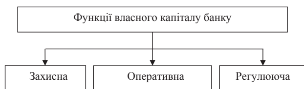
Рис. 1. Функції власного капіталу банку

Згідно з законом України «Про банки та банківську діяльність» існують такі функції власного капіталу.