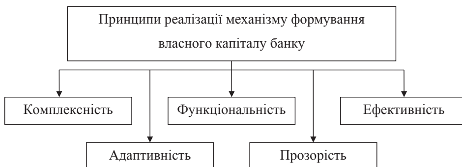
Рис. 2. Принципи реалізації механізму формування власного капіталу банку

Комплексність полягає в тому, що всі заходи, пов'язані із процесом формування власного капіталу, необхідно здійснювати у взаємозв'язку з іншими напрямками діяльності банку. Функціональність передбачає, що всі складові цього механізму мають чітко визначені завдання і спрямовані на досягнення єдиної мети – формування достатнього власного капіталу банку. Адаптивність – це здатність механізму змінюватися та вдосконалюватися під впливом зовнішніх і внутрішніх факторів. Принцип ефективності передбачає, що цей