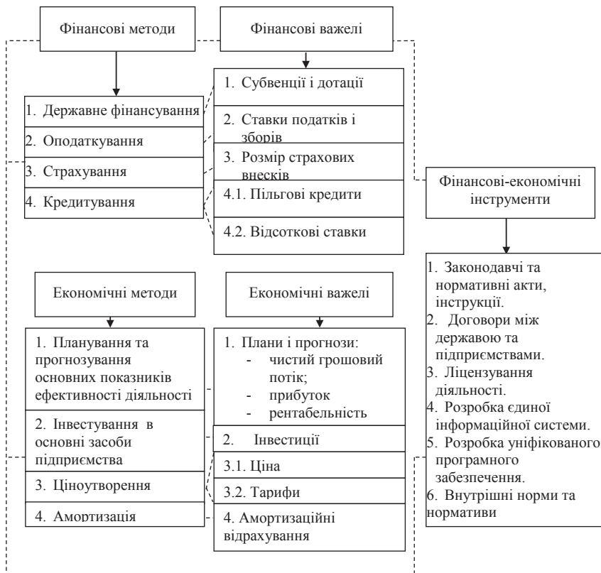
Рис. 1. Структура фінансово-економічного механізму забезпечення ефективності функціонування підприємства