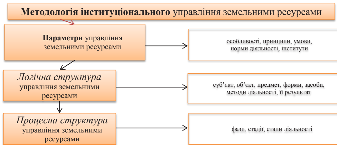
Рис. 1. Структурно-логічна модель методології інституціонального управління земельними ресурсами