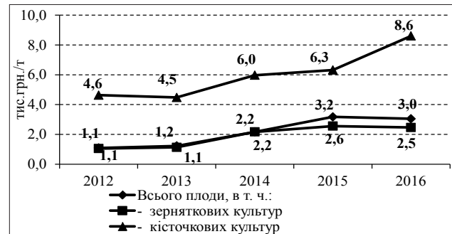
Рис. 3. Закупівельні ціни сільськогосподарських підприємств на плодове сировину, тис. грн./т

Відстежуються зміни цін у регіональному розрізі та по роках, що пояснюється різницею у пропозиції та затребуваності в сировині переробними підприємствами. Так, найдорожче реалізувалися зерняткові плоди для переробки у Чернівецькій, Львівській та Миколаївській областях – від 3,0 до 3,6 тис. грн. за 1 т, а кісточкові у Херсонській, Львівській та Одеській – від 7,3 до 12,3 тис. грн./т. Значно нижчі ціни спостерігаються на зерняткові плоди у Запорізькій, Чернігівській та Черкаській областях – 1,6-2,0 тис. грн./т, а на кісточкові у Вінницькій та Донецькій (2,0-2,9 тис. грн.).