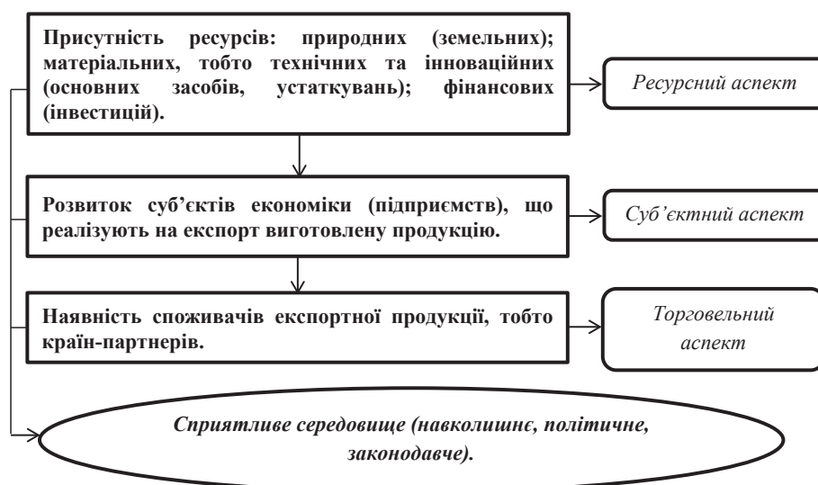
Рис. 1. Основні аспекти розвитку експортного потенціалу України