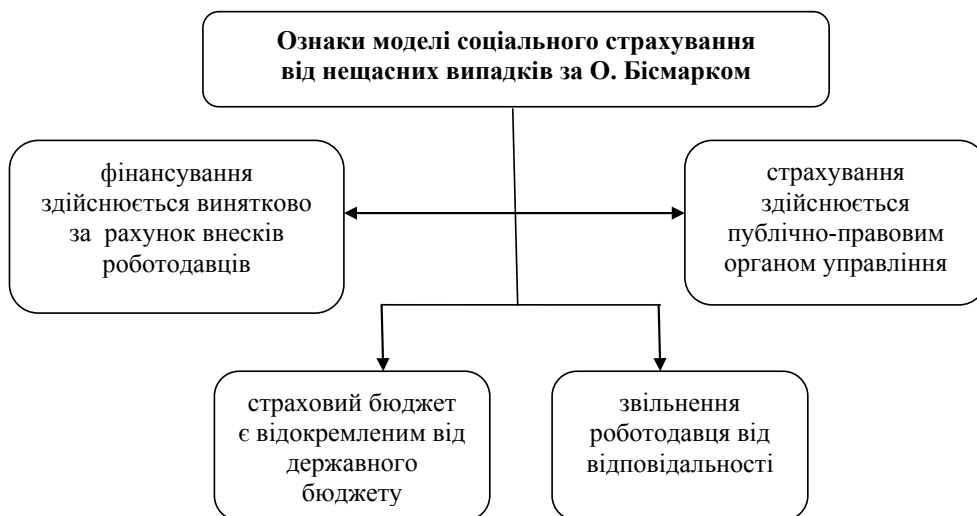
Рис. 1. Характерні ознаки моделі соціального страхування від нещасних випадків на виробництві за О. Бісмарком

На відміну від попередньої моделі соціального страхування, обов'язки страховика у системі соціального захисту Великобританії покладені на державний орган – Департамент праці та пенсій, який знаходиться у безпосередньому підпорядкуванні відповідного Міністерства. Особливістю цієї системи страхування є те, що у страховика відсутні можливості отримання прибутку, а у страховальника – можливість заміни страховика і переходу до іншого суб'єкта страхування. Також відсутній взаємозв'язок між розміром внесків пра-