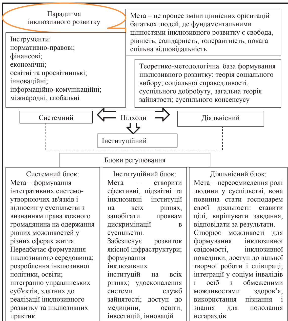
Рис. 2. Структурні елементи парадигми інклюзивного розвитку

У запропонованій моделі всі блоки (системний, діяльнісний та інституційний) пов'язані між собою. Окремі складники відіграють значну роль у форму-