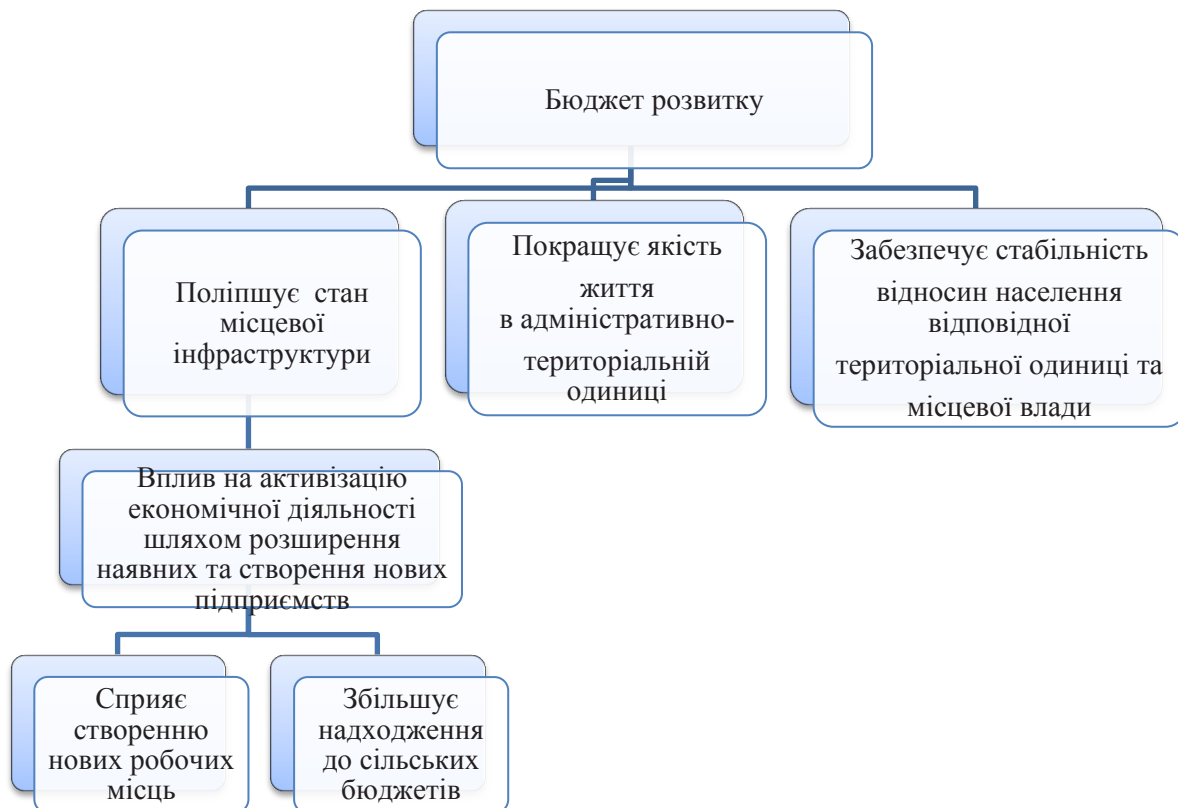
Рис. 1. Вплив бюджету розвитку місцевих бюджетів на соціально-економічний розвиток території

Бюджети ОТГ беруть участь у горизонтальному вирівнюванні податкоспроможності. Відповідно до цієї системи, для встановлення базової або реверсної дотації визначається індекс податкоспроможності місцевого бюджету. За умови, що індекс менший від 0,9, бюджетам ОТГ надається базова дотація в обсязі 80% суми, необхідної для досягнення значення такого індексу забезпеченості відповідного бюджету. З метою досягнення середнього рівня станом на 2016 р. 125 бюджетів отримали базову дотацію, порівняно з 2017 р. кількість скоротилася більш ніж удвічі (293 бюджети в 2017 р.).