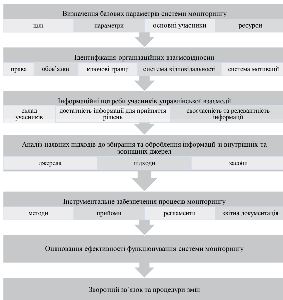
Рис. 1. Етапи формування системи моніторингу реалізації стратегічних орієнтирів економічної безпеки інвестиційної діяльності підприємства

Особливістю цього етапу є необхідність змін не лише операційних процесів реалізації стратегічних орієнтирів економічної безпеки інвестиційної діяльності, але й більш глобальних. Отже, в процесі функціонування системи моніторингу можуть ідентифікуватися нові «вузькі місця» як у загальній стратегії розвитку підприємства, так і у функціональних стратегіях.