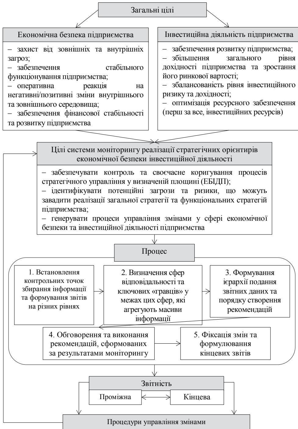
Рис. 3. Система моніторингу реалізації стратегічних орієнтирів економічної безпеки інвестиційної діяльності

Як було зазначено вище, основні цілі системи моніторингу обумовлюються цілями функціону-