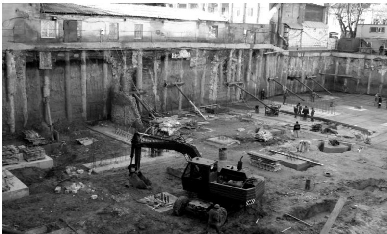
Рис. 2. Общий вид котлована на участке I-ой очереди строительства подземной части, ул. Екатериненская

паркинга возводимого здания и воспринимались специально выполненными фундаментами, устроенными ниже уровня подошвы ростверков, рис. 2.