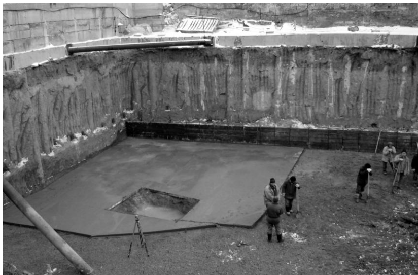
Рис. 4. Ограждение котлована сваями с усилением распорками и подпорками, ул. Успенская

На протяжении выполнения работ по устройству подземной части здания выполнялся геотехнический мониторинг, который включал определение последовательности отрывки котлована, постоянный контроль качества выполнения работ, измерение горизонтальных перемещений ограждения котлована в уровне верха ростверков, наблюдения за осадками возводимых и примыкающих зданий. Получаемые в процессе мониторинга данные позволяли выполнять корректировку проектных решений в процессе устройства ограждений.