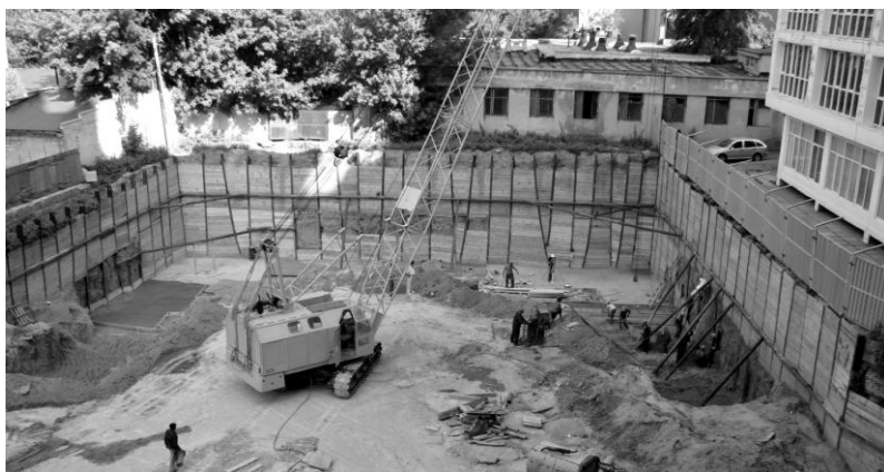
Рис. 5. Общий вид котлована, ул. Литературная

Глубина котлована от уровня существующей дневной поверхности составила около 8,0 м. Шпунтовые сваи выполнялись из прокатных швеллеров и двутавров, вдавливаемых в грунты основания с шагом 1,5 м. Подпорно-распорная система была выполнена из стальных труб \varnothing 133 мм с передачей усилий на грунты основания посредством устройства дополнительных упорных фундаментов. Для исключения обтекания грунтом шпунтовых свай предусматривалось устройство забирки в виде сплошного дощатого наката, рис. 5.