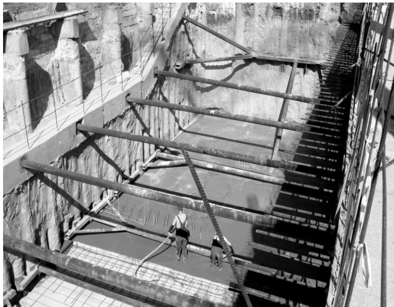
Рис. 3. Устройство распорок при строительстве II-ой очереди

паркинг. С трех сторон к площадке строительства вплотную примыкали существующие здания: жилые дома № 41 (3 эт.), № 34 (2 эт.) и админздание (4 эт.). Дом № 41 является памятником архитектуры. Расстояние между наружными гранями стен существующих и возводимого зданий составляет: в зоне примыкания жилого дома №41 и админздания – 0,5 м, в зоне примыкания жилого дома №34 – 2,5 м.