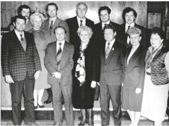
Колектив кафедри факультетської терапії та гості

оздоровчих дієт, фізіотерапії, вживанню мінеральних вод. Ця система дала потужний імпульс розвитку вітчизняної охорони здоров'я. Спочатку на Буковині в 1961 р. при поліклініках відкрилися перші гастроентерологічні кабінети, пізніше – відділення реабілітації в лікарнях, відділення відновлювального лікування в санаторіях, мережа профілакторіїв.