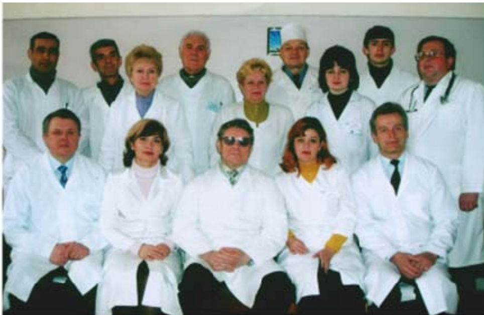
Колектив кафедри внутрішньої медицини та фізіотерапії (2004 р.)