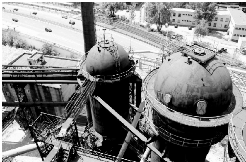
Рис. 2. Горно-металлургический промышленный ареал в г. Острава, находящийся в стадии комплексной реновации, предполагающей интеграцию множества социально-культурных функций: музеи, смотровые площадки, концертные залы, площадки для фестивалей, научные центры и др. Национальный памятник культуры Чешской республики, состоящий так же в реестре "Европейское наследие"

государственная система и самостоятельная область науки, занимающаяся изучением, оценкой, регистрацией и охраной потенциальных памятников архитектуры индустриального наследия в Чешской республике [6, 7].