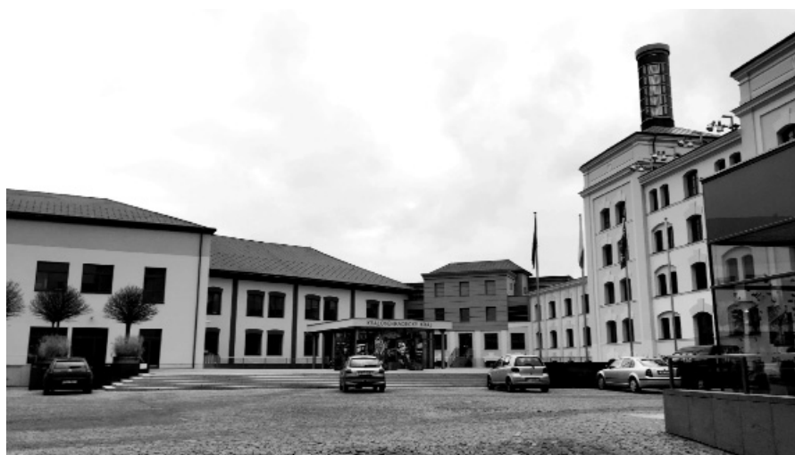
Рис. 1. Здание пивоварни в г. Градец Кралове (1844-1846 гг) реконструированное в 2005-2007 гг под районную государственную администрацию, центр европейского проектирования, региональные правительственные организации, филиал Карлового университета, Галерею Владимира Прецлика, а так же мини-пивовар (с музеем), ресторан "Новый пивовар" и парковку. Памятник культуры Чешской республики

Что касается охраны, впервые такая практика была реализована лишь в начале 60-х лет XX века и со временем сформировалась как комплексная